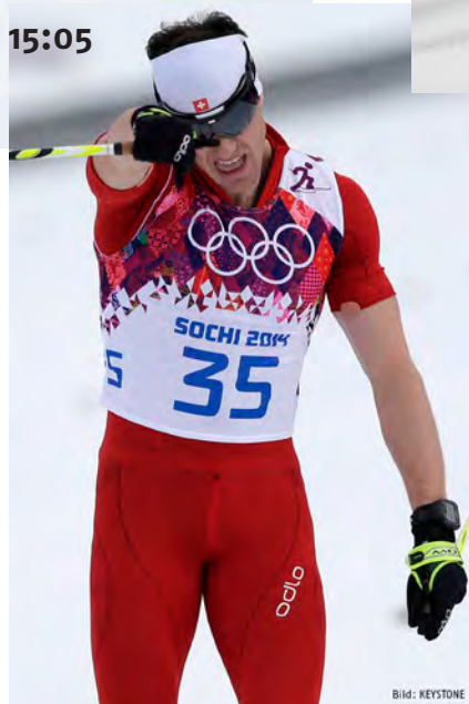
Dario Cologna, campiuon olimpic passlung 15km classic