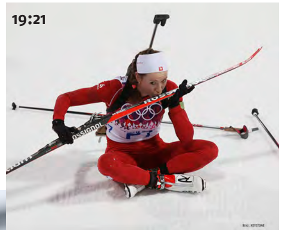
Selina Gasparin, gudagnaderdra medaglia d'argient biathlon 15km singul