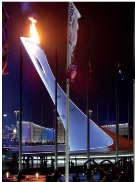
The Olympic Flame