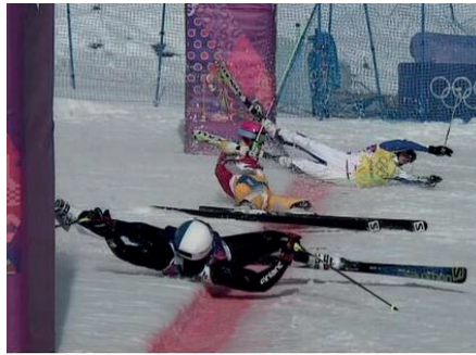
Fanny Smith vor 5 Stunden