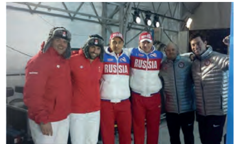
Le podium du bob